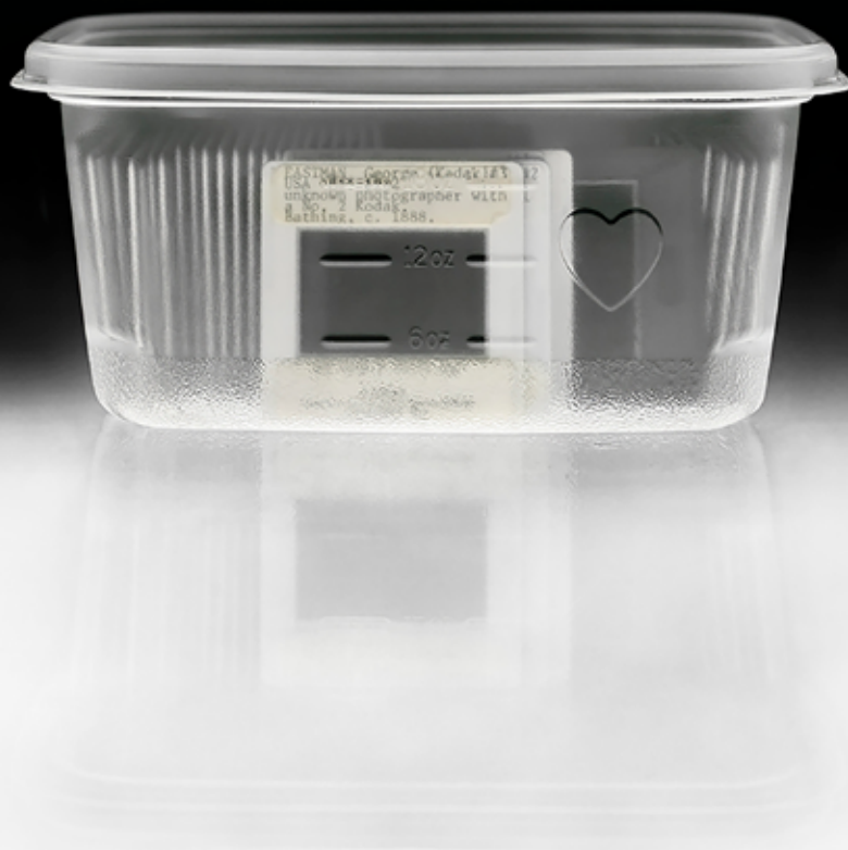
Susan Dobson, Eastman, George, Unknown Photographer with a No. 2 Kodak. Bathing, c. 1888, lightbox with backlit film, 2018